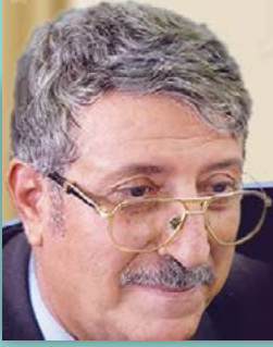
د/عبد العزيز المقالح